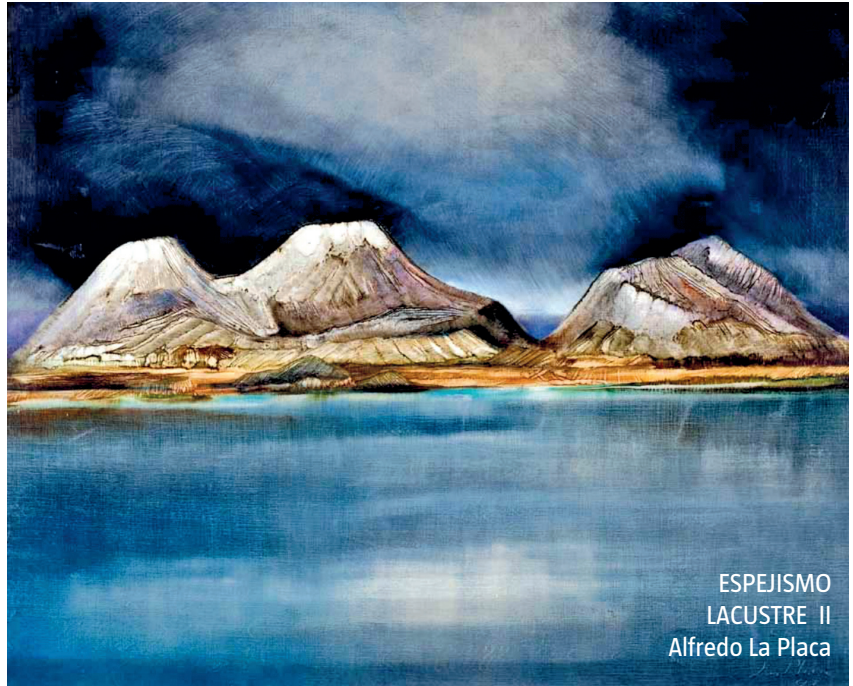
ESPEJISMO LACUSTRE II Alfredo La Placa